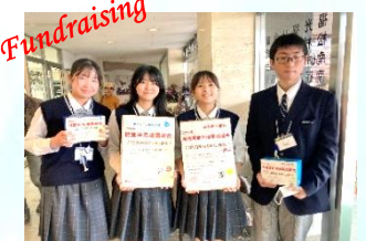
募金活動（協力 福野高校177部）