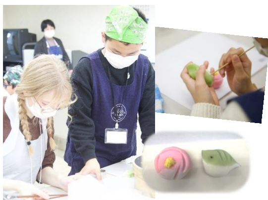
▲和菓子作り体験 それぞれ個性豊かな梅とウグイスを作りました