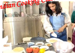
インドの料理教室