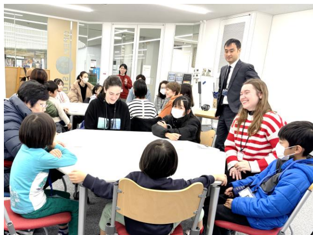
▲金沢大学の大きな図書館で交流会

この催しは、南砺に住む子どもたちが異なる文化を知って楽しんだり、外国につながる子どもたちが、留学生の皆さんとの交流を通して将来の選択肢を広げたりすることを目的として、今年度初めて開催されました。南砺市と包括連携協定を締結している金沢大学の協力により、延べ28名の留学生にご参加いただきました。南砺の子どもたちも外国につながる子どもたちを含め、延べ57名参加しました。どの回でも、最初は少し恥ずかしがっていた子どもたちですが、留学生のお兄さんお姉さんがやさしくお話を聞いてくださり、だんだん笑顔が増えていきました。参加者や保護者からは「学校にはない経験が出来て良かった」「とてもいい機会親子共々いい刺激となりました」などの声が聞かれました。