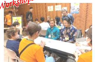
インドネシアのカードゲーム