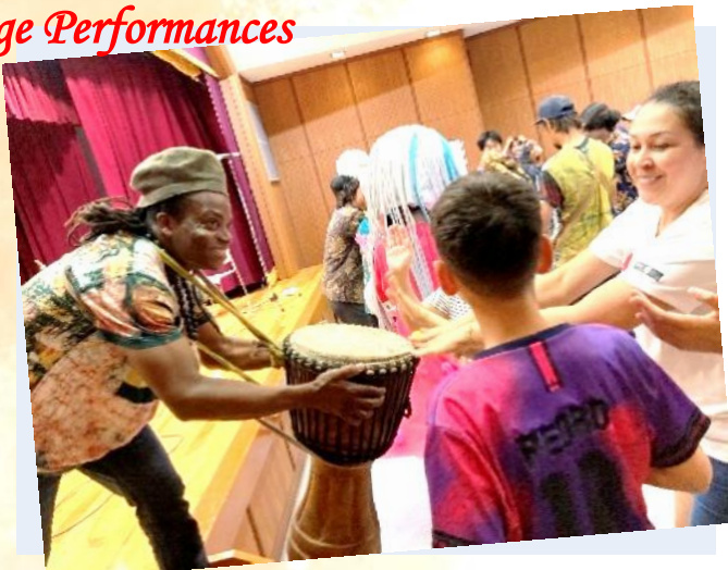
ステージパフォーマンス (AVOUDE)