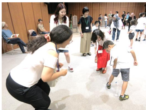
▲インドネシアのゲームに挑戦！