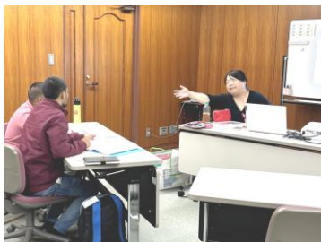
▲基礎日本語クラス