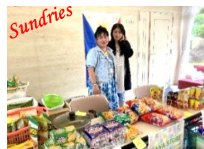
フィリピン雑貨販売