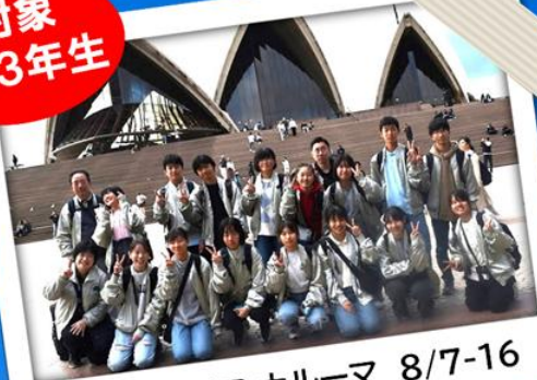
オーストラリア ナルーマ 8/7-16