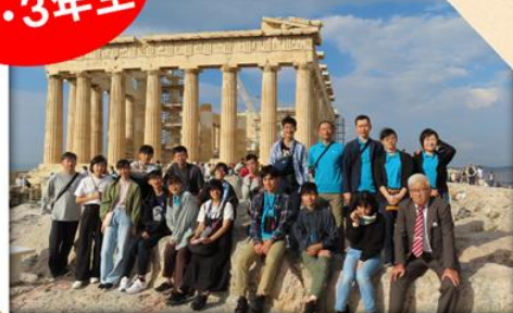
ギリシャ デルフィ 10/27-11/3