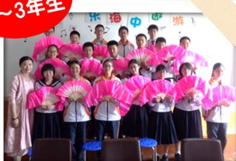
中国 紹興市 10/28-11/1