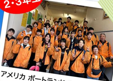
アメリカ ポートランド 10/26-11/5