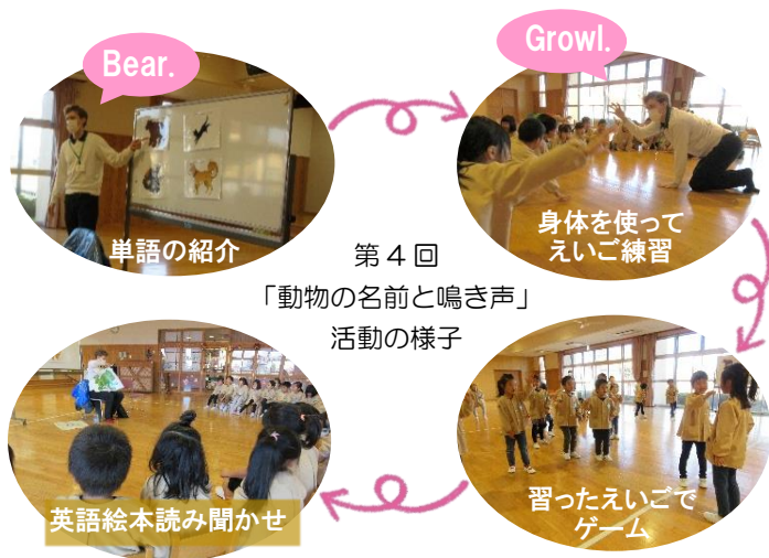
第4回 「動物の名前と鳴き声」 活動の様子

年間を通して、あいさつから始まり、数字・色・動物へと内容を深めていきました。最後に読み聞かせをした英語絵本では、習った「えいご」がたくさん出てきて、子ども達から自発的に英語を口にする様子が見られました。