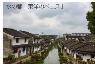
④中華人民共和国 浙江省 紹興市