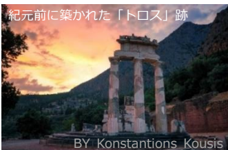
①ギリシャ共和国 デルフィ市