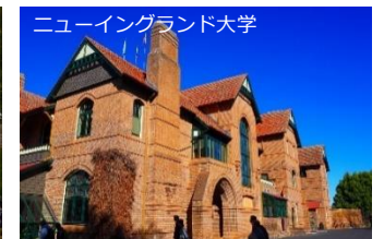
⑦オーストラリア連邦 アーミデール市