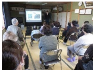
▲西町ぬくぬくサロン 日本語でアメリカ文化の紹介をしました。

異文化について楽しみながら学んでみませんか？市国際交流員が出前講座に伺います。皆様からのお申込みをお待ちしております。