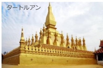
③ラオス人民共和国 ビエンチャン都