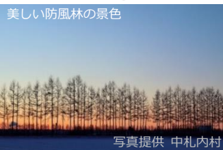
②北海道 河西郡 中札内村