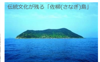
⑧香川県 仲多度郡 多度津町