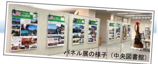
パネル展の様子（中央図書館）

新型コロナウイルスの影響によりほとんどの交流事業が中止となりました。しかし、こんな今だからこそ、今一度交流都市の魅力を市民の皆様へ届けたいとの思いから、令和3年1月7日（木）～3月14日（日）にかけて市内3会場において「国内国際交流都市紹介 パネル展」を開催しました。コロナ収束後には、ぜひこれらの地域を訪れてみたいですね。