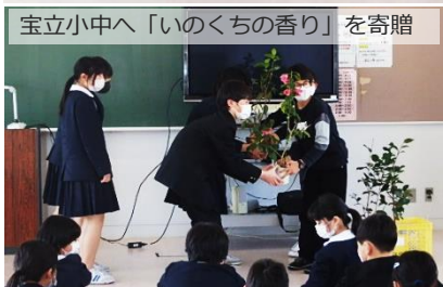
宝立小中へ「いのくちの香り」を寄贈

令和3年2月9日（火）～10日（水）、井口小学校5・6年生児童22名が、椿を市の花木とする石川県珠洲市へ派遣され、珠洲市立宝立小中学校児童と初めて交流をしました。椿の児童親善大使は、これまで隔年で東京都大島町へ派遣されていましたが、次年度より義務教育学校となること等を機に、新たな交流がスタートしました。新型コロナウイルス感染症防止対策等、学校間で事前に直接連絡調整を重ねた上で実施することができました。