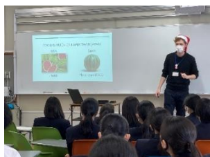
▲南砺福野高等学校 国際科1年生を対象に英語で行いました。

内容 例:海外から見た南砺市 ※1回 30~90分程度 対象 市内の10名以上の団体 ※条件あり (老人クラブ、婦人会、学校等)