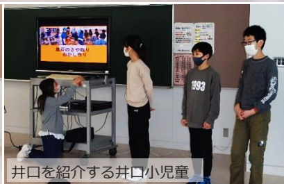
井口を紹介する井口小児童

宝立小中学校は、5年前より義務教育学校となり、規模も井口小学校と似かよっています。本年4月より「南砺つばき学舎」