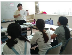
日本語教師が丁寧に教えます